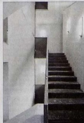
Ein Ort der Ruhe im Lehel: Die umfangreichen Sanierungsarbeiten am St.-Anna-Kloster sind abgeschlossen.